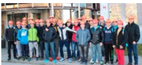
Dijaki srednje strojne šole iz Škofje Loke

V Acroniju omogočamo ogled proizvodnje v obliki vodenih ekskurzij. Naši najpogostejši obiskovalci so dijaki srednjih tehniških šol in učenci zadnjih letnikov osnovnih šol. Ekskurzije vodijo varnostni inženirji in tehnologi, kadar je treba bolj podrobno razložiti delovne