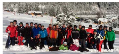
Tekmovanje v Kranjski Gori je potekalo v prijateljskem vzdušju.

V Kranjski Gori je v soboto, 14. januarja, potekalo že šesto tradicionalno smučarsko tekmovanje v veleslalomu med nami in našimi poslovnimi partnerji, podjetjem RHI. SIJ acronijevci smo se v konkurenci 27 tekmovalcev in tekmovalk odrezali zelo dobro.