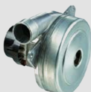
Vakuumski električni motor za suho in mokro sesanje.