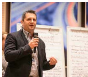
Vodstvo Skupine SIJ je bilo zadovoljno s predlogi za odpravo ozkih grl.

Konec decembra je v Laškem potekala tradicionalna strateška konferenca Skupine SIJ.