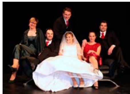
Gledališka ekipa romantične komedije Trikrat da