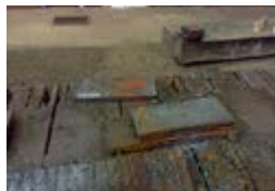
Vzorci jekla, odrezani z ulitega slaba