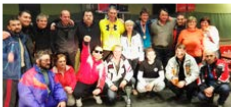
Udeleženci zimskih iger SKEI

Na Rogli se je 22. januarja odvijalo 22. državno prvenstvo v zimskih igrh sindikata SKEI Slovenije. Na njih so sodelovali tudi naši sodelavci.