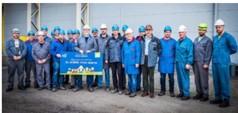
Prvi v varnosti na Jesenicah: sodelavci Vroče valjarne so prejeli čestitke in nagradni bon, ki že krasi vhod v obrat.