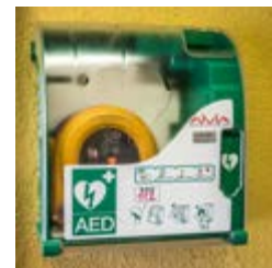
Defibrilator je nameščen v »Kremšnitni« pri vratarju.

Defibrilator je varna naprava, ki sama prepozna srčni ritem. Zato je ključno, da na osebo čim prej namestimo elektrode, nato pa nas naprava sama vodi skozi postopek oživljanja do prihoda reševalcev.