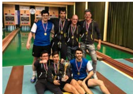
Ekipa, ki bo naslednjo sezono zastopala naše barve v prvi slovenski ligi.