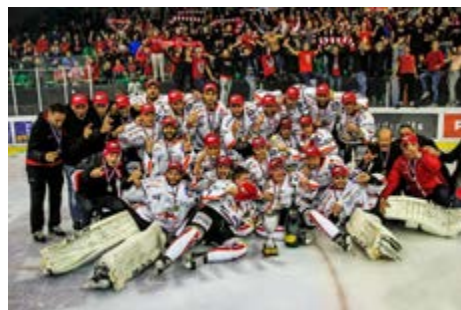
Veselje ob osvojitvi naslova je bilo nepopisno.