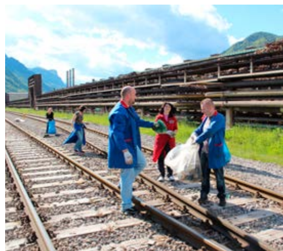
V okolici obrata Vroča valjarna se je največ čistilo ob tirih.