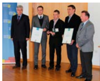
Prejemniki zlatega priznanja Območne gospodarske zbornice za Gorenjsko