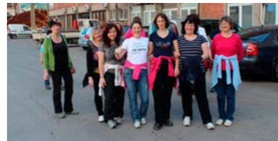
Dobre volje ni zmanjkalo.