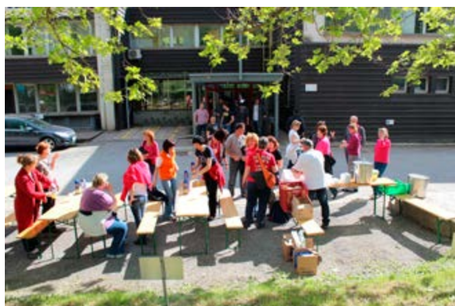
Na koncu še zaslužena malica