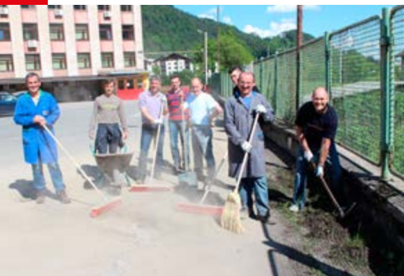
V okolici obrata Predelava debele pločevine je pomagalo čistiti več kot 50 parov pridnih rok.