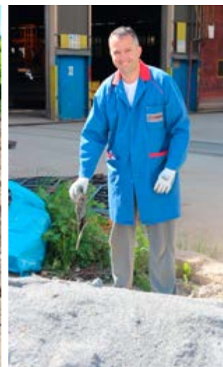
Nič nam ni težko ...