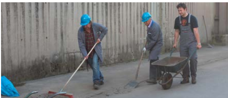
Okolico obrata Hladna predelava je bilo treba pomesti.