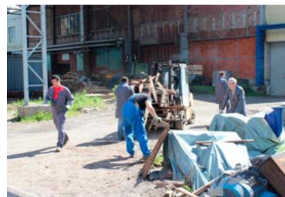
V okolici obrata Predelava debele pločevine je pomagalo čistiti več kot 50 parov pridnih rok.