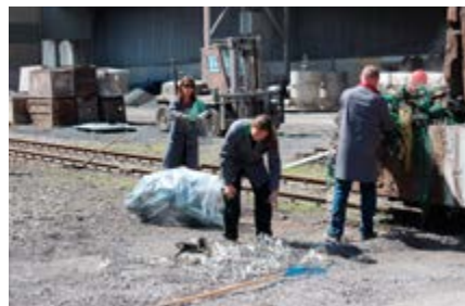
Več ekip je čistilo okolico obrata Jeklarne, čistilne naprave in hale legur.