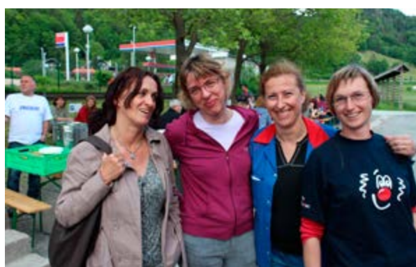
Zahvala gre tudi organizatorkam akcije.