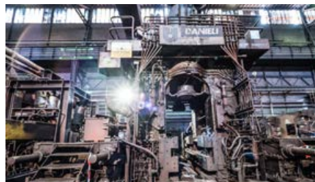
Glavno ogrodje Steckel v obratu Vročna valjarna

Po natančni preučitvi vseh možnosti je vodstvo družbe v najkrajšem možnem času sprejelo najugodnejšo ponudbo, ki nam bo zagotovila najhitrejšo in najbolj ustrezno rešitev. Pri družbi Nidec smo najeli opremo za napajanje glavnega motorja s časom vgradnje 30–45 dni, s čimer smo pridobili dragocen čas, v katerem bomo sprejeli odločitev o