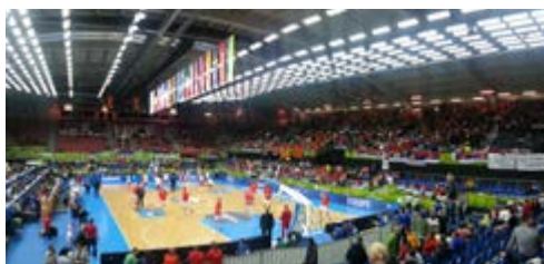
S tekme med reprezentancama Srbije in Črne gore

Predtekmojanja na Eurobasketu 2013 so uspešno za nami. Dvorana Podmežakla je bila ena najbolje obiskanih dvoran prvenstva. Organizatorji na Jesenicah so s potekom in z obiskom prvenstva zelo zadovoljni.