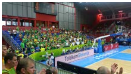
Na Jesenicah sta se pomerili tudi reprezentanci Latvije in Litve.

Predtekmojanja na Eurobasketu 2013 so uspešno za nami. Dvorana Podmežakla je bila ena najbolje obiskanih dvoran prvenstva. Organizatorji na Jesenicah so s potekom in z obiskom prvenstva zelo zadovoljni.